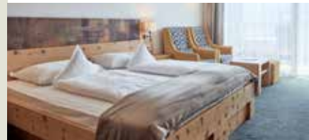
Juniorsuite Dolomiten ab 134 € 30 m², Balkon mit Dolomitenblick, 2 – 4 Pers. + Sitzecke