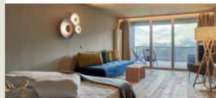
Vinum Loge ab 159 € 47 m², Balkon mit Dolomitenblick, 2 – 3 Pers. + Klimaanlage, Sitzlounge und Holzboden