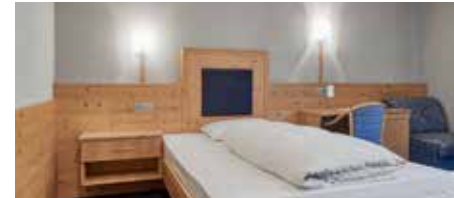
EZ Königanger ab 124 € 16 m², Balkon zur Rückseite, 1 Person