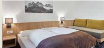
DZ Königanger ab 101 € 20 m², Balkon zur Rückseite, 2 Personen