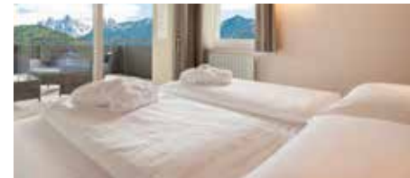
Suite Geisler ab 144 € 40 m², Balkon mit Geislerblick, 2 – 4 Personen + Wohnzimmer mit Sitzecke und getrenntes Schlafzimmer