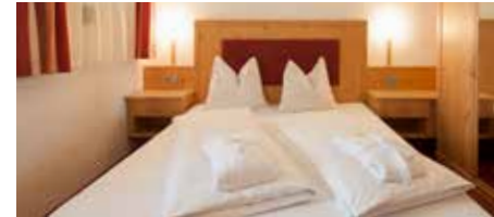
DZ Königanger superior ab 106 € 25 m², Balkon zur Rückseite, 2 – 4 Personen + Sitzecke