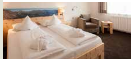
Suite Radlsee ab 134 € 45 m², Balkon Nordseite, 2 – 5 Personen + Badewanne, Schlafzimmer mit Sitzecke und getrenntes Wohnzimmer