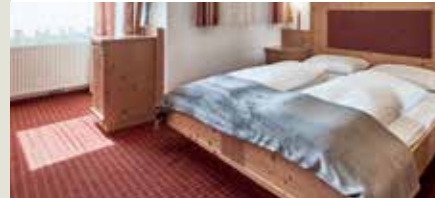
DZ Dolomiten ab 116 € 25 m², Balkon mit Dolomitenblick, 2 – 4 Pers. + Sitzecke