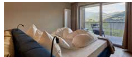
Panorama Nest ab 144 € 30 m², Balkon mit Dolomitenblick, 2 – 3 Pers. + Sitzlounge und Holzboden